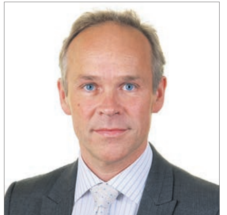
Firar på krava. Kommunalminister Jan Tore Sanner går mot kravet om eit minimumstal på innbyggjarar.

Sanner seier at regjeringa vil leggje fram ei stortingsmelding våren 2015. Den vil handle om kva for oppgåver som kan bli overført til større og meir robuste kommunar. Då vil også eit regionalt folkevald nivå vere tema.